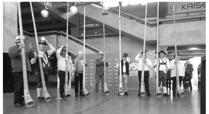
Bildtitel: Ensemble der Alphornbläser Baden-Württemberg (ABW)

bei „Tage der Chor- und Orchestermusik“ des Bundesmusikverbandes Chor & Orchester BMCO.