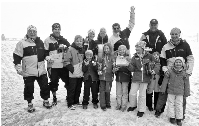
Bild: Ski-Club Kreenheinstetten - die Rennläufer mit Ihren Trainern und Betreuern.

Herzlichen Glückwunsch allen Teilnehmern.