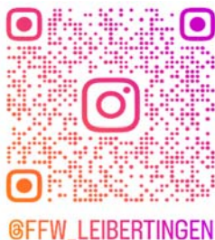
QR-Code einfach mit dem Handy scannen!

Wir erklären und zeigen gerne, welche Aufgabenbereiche die Feuerwehr hat und wie wir diese als Team bewältigen können.