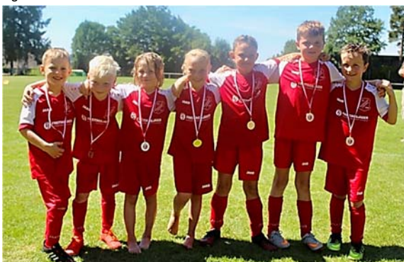
Bambinis des SV Kreenheinstetten