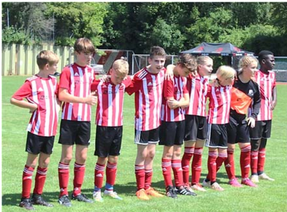
D-Jugend des SV Kreenheinstetten

Auch unsere Bambinikicker hatten viel Spaß am vergangenen Sonntag beim Josef-Lutz-Cup. Bei strahlendem Sonnenschein konnten tolle Spiele und begeisterte Kinder beobachtet werden.