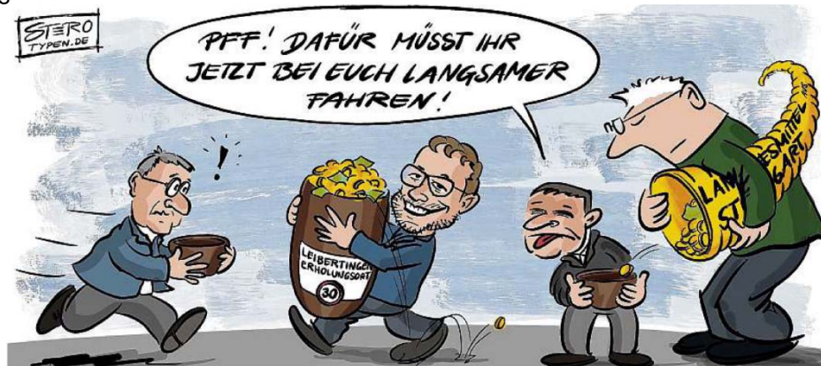
Manches Prädikat ist eben auch sein Geld wert

vorhanden, jedoch aufgrund der Vakanz der Möglichkeit nicht gegeben. Ziel der Gemeinde ist es somit, die touristische Infrastruktur zu stärken durch Stärkung der Natur und Umwelt, der touristischen Möglichkeiten, der Grundversorgung, der ärztlichen Grundstruktur, der Ladeinfrastruktur für E-Bikes, der Schöpfung und Kreierung einer Regionalmarke und der Prädikatisierung der Gemeinde in Gänze zur Vermarktung, aber auch zur Steigerung der Einnahme- und Fördermöglichkeiten. Nicht nur die Gemeinde Leibertingen, sondern auch die Hochschule Albstadt-Sigmaringen, kam in einer gesonderten Studie 2021 zu selbigem Ergebnis. Ein weiteres Defizit zeigten beide Studien in der Vermarktung der Übernachtungsmöglichkeiten und der kulinarischen Gegebenheiten auf. Kulinarischer Tourismus stellt ein enormes Potenzial für die gesamte Region dar, zeigen beide Untersuchungen sowie das Tourismuskonzept des Landes Baden-Württemberg auf. In diesem Bereich ist eine sehr große und überdurchschnittliche Bereitschaft des touristischen Publikums vorhanden, Geld auszugeben. Die Betriebe sind daher angehalten, deutlich in die Vernetzung und Vermarktung zu investieren.