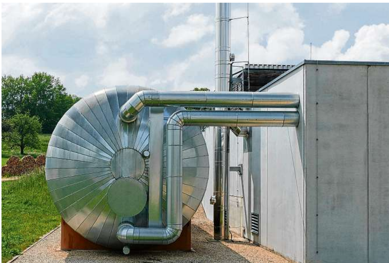
Ein Pufferspeicher, wie hier in Leibertingen, soll die Versorgungssicherheit für die Bezieher von Nahwärme erhöhen.