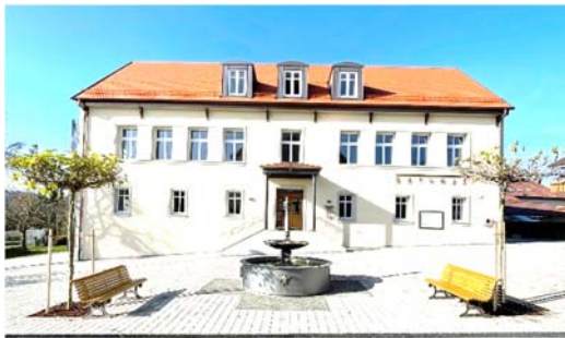
Dorfplatz mit Brunnen zwischen dem Haus der Vereine und der Kirche