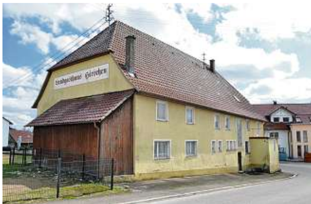
Das Gebäude des ehemaligen Gasthaus zum Hirschen in Altheim.

Der Ortschaftsrat von Altheim hat zur Genehmigung des Umbaus be-