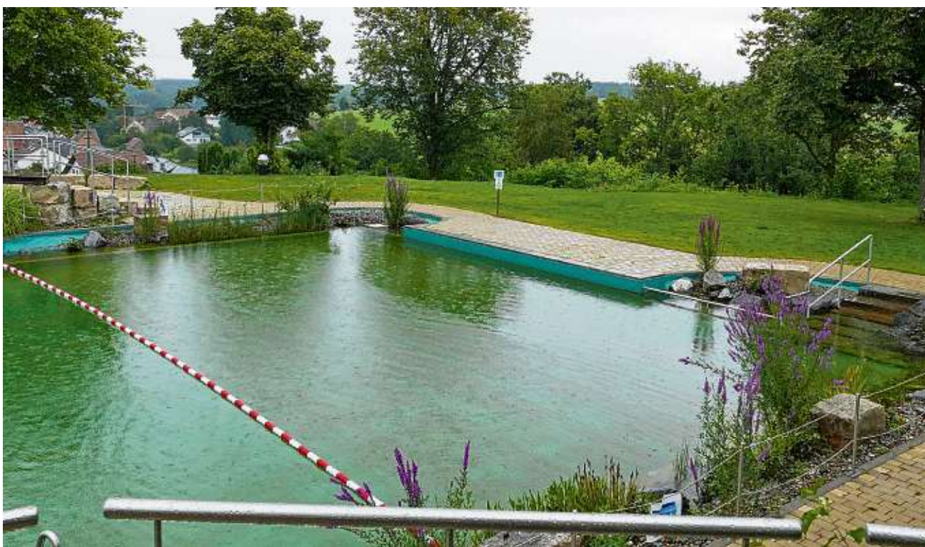
Die Badesaison verlief im Naturbad Thalheim wegen des durchwachsenen Wetters schleppend.

Die Gäste auf dem Leibertinger Campinggarten kommen weitgehend aus dem nahen Umkreis bis etwa 150 Kilometer. Inzwischen kämen aber auch viele Gäste vom Bodensee, berichtet Gastgeberin Klaus. Diese flüchteten zumeist aus den dortigen Touristen-Orten, die wegen der Corona-Pandemie noch voller seien als sonst. Insgesamt sei zu beobachten, dass die Gäste immer kurzfristiger buchen würden.