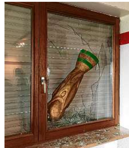
Der große, hölzerne WM-Pokal wurde in die Fensterscheibe geworfen.