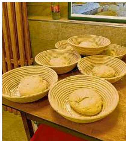
Backtag ist im Thalheimer Backhaus immer montags.

Leibertingen – Eigentlich ist das neue „Haus der Vereine“ im Leibertinger Ortsteil Thalheim bis auf wenige Arbeiten fertig. Das geplante Einweihungsfest ist aber wegen der aktuellen Pandemielage auf einen bisher unbekanntem Termin im Sommer kommenden Jahres verschoben. Die zukünftigen Nutzer der neuen Räumlichkeiten ziehen aber bereits ein – wie der Ortsvorsteher oder die Köhlerzunft. Auch das Backhaus ist aus der ehemaligen Thalheimer Schule wieder in das ehemalige Rathaus umgezogen und bereits in Betrieb. Mit dem Umzug hat die Bürger-Backstube auch den dringend benötigten neuen Backofen und das Teigrührgerät erhalten. Eine Anschaffung, die immerhin etwas über 10 000 Euro gekostet hat. Rund 7000 Euro davon kamen von der Leader-Aktionsgruppe Oberschwaben, dem Förderprogramm der EU und des Landes Baden-Württemberg für den Ländlichen Raum.