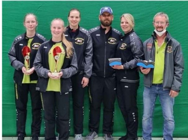
links die Sieger der Bezirksmeisterschaft in Schliengen, rechts die Sieger des Hallenturnieres in Meßkirch

Der Schützenverein Altheim-Thalheim lud zum 3. Weißwurstcup ein. Aufgrund der aktuellen Situation mit Corona war die Teilnahme bei vorheriger Anmeldung und unter Einhaltung des Hygienekonzeptes möglich.