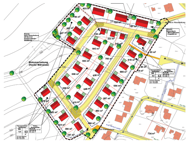
Baugebiet Kreenheinstetten West