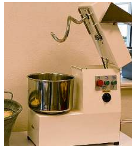
Das neue Teigrührgerät im Backhaus Thalheim.

Das gemeinsame Backen hat in Thalheim eine lange Tradition. In einer Reparaturrechnung aus dem Jahr 1870 wird der Backofen in Thalheim zum ersten Mal schriftlich erwähnt. Backtag ist im Thalheimer Backhaus immer montags. Die individuellen Zutaten sind von 7.30 Uhr bis spätestens 10 Uhr im Backhaus Im Brühl abzugeben. Zwischen 17 und 18.30 Uhr kann das fertige Brot abgeholt werden. Die Gebühren für das Backen können auf der Homepage der Gemeinde Leibertingen eingesehen werden. (hst)