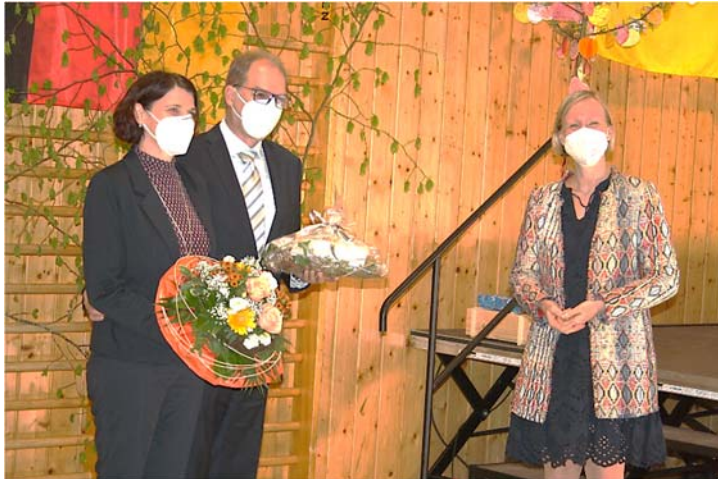
Verabschiedung des scheidenden Bürgermeisters Armin Reitze durch Landrätin Bürkle