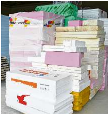
Beim Schneiden der Dämmplatten soll es möglichst wenig Verschnitt geben.