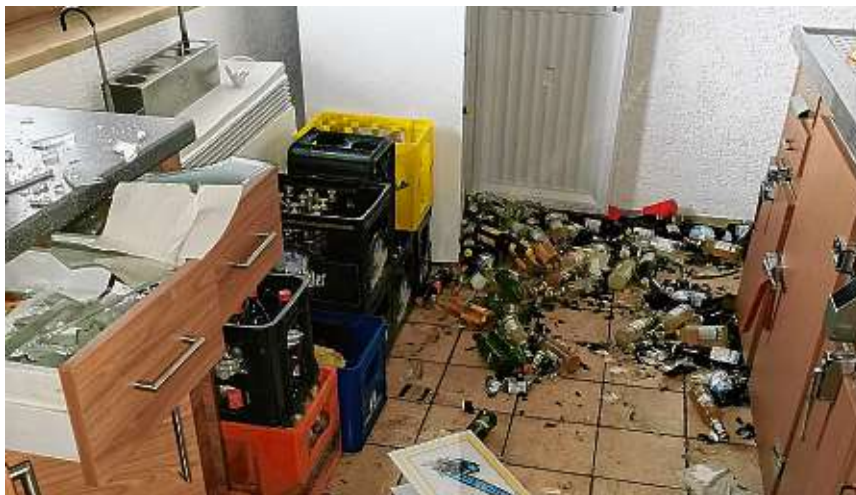
Die Renovierung der Küche im Sportheim wurde gerade im Juli abgeschlossen. Nun ist praktisch wieder alles kaputt.