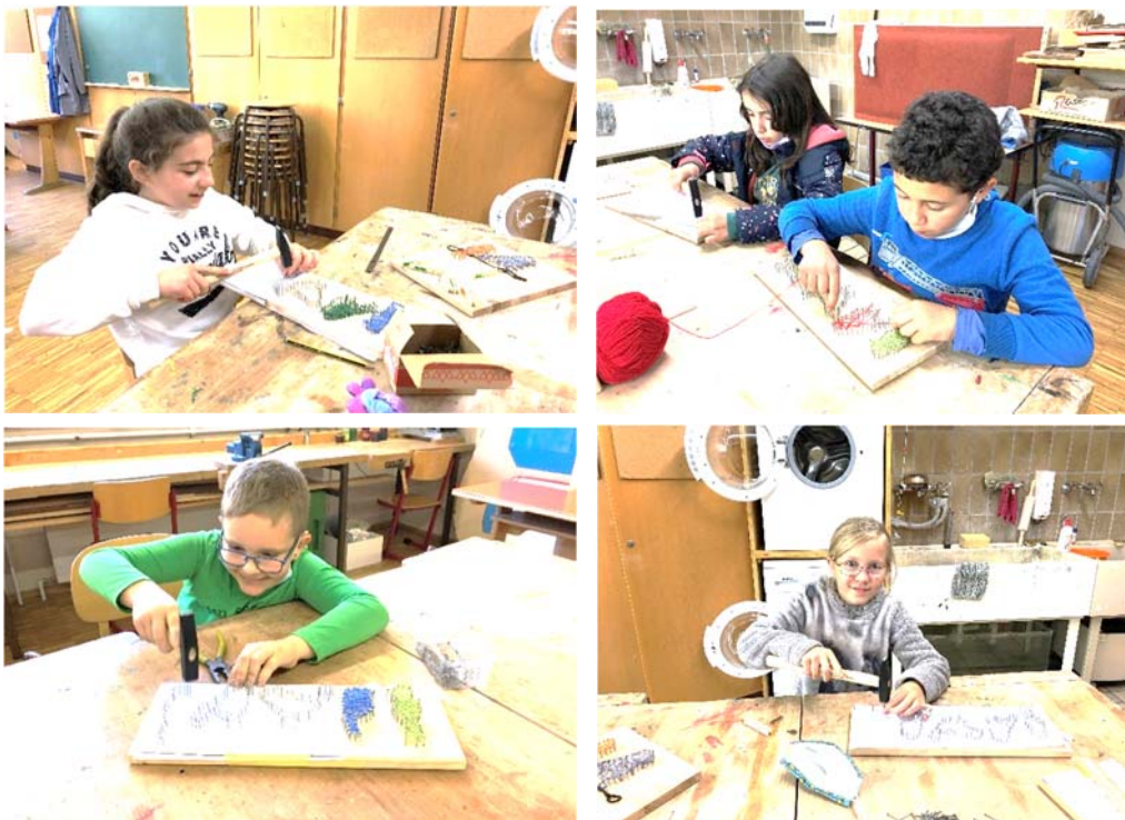
(aktuelle Holz-AG vom 28. Oktober 2021)

Bezüglich der außerunterrichtlichen Betreuung an der Wildensteinschule können sich Schülerinnen und Schüler während des Präsenzunterrichts wie gewohnt an drei Essenstagen in der Woche (Di., Mi., Do.) zum Mittagessen und zur Betreuung anmelden. Des Weiteren wird an allen Schultagen eine Frühbetreuung ab 06:50 Uhr sowie eine Hausaufgaben- und Angebotsbetreuung am Nachmittag (Di., Mi., Do.) angeboten.