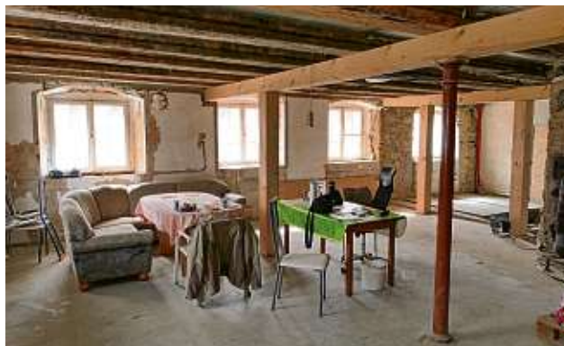
Das Haus wird entkern und Stützen eingezogen, wo die alte Bausubstanz es erfordert.

reits Stellung genommen. In der jüngsten Sitzung waren die Wortmeldungen zum Vorhaben, das Gasthaus zu einem Wohnhaus werden zu lassen, durchweg positiv. „Es ist erfreulich, dass ein leerstehendes Haus in der Ortsmitte, wieder einer Nutzung zugeführt wird“, äußerte sich Altheims Ortsvorsteher Helmut Straub in der Versammlung. Einzig zur Parkplatzsituation auf dem Gebäudegrundstück äußerte der Rat Bedenken. Für die sechs Wohneinheiten sind gegenwärtig sechs Parkplätze vorgesehen. Baurechtlich ist das in Ordnung, aber in der Realität wird zu meist mehr Parkraum benötigt. Die Stellungnahme des Ortschaftsrats enthält deshalb die Empfehlung, die Verkehrsbehörde möge die Situation vor Ort prüfen. Der Leibertinger Gemeinderat erteilte am Dienstag sein Einvernehmen zum Bauantrag. Er folgte der Empfehlung des Altheimer Ortschaftsrats, die Baubehörde auf die Parkplatz-