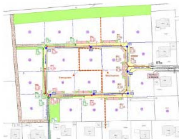
Baugebiet Thalheim West

Für neue Bauherren und Häuslebauer konnten dieses Jahr verschiedene Maßnahmen für neue Bauplätze durchgeführt werden: Das Verfahren für das Baugebiet Thalheim West wurde erstellt und die Ausgleichsfläche hergestellt. Nun muss auf die Ansiedlung der Feldlerche auf der Ausgleichsfläche gewartet werden, dann wird die Umsetzung des Baugebiets Thalheim West, mit 20 freien neuen Bauplätzen forciert. Bei dem Baugebiet Kreenheinstetten West wurde der Bebauungsplan erstellt. Von 15 Grundstücken sind im Vorverkauf bereits 7 verkauft worden. Im ersten Bauabschnitt wurde bereits der Humus der geplanten Straße abgeschoben und die Ausschreibung für die Gesamterschließung des ersten Bauabschnitts ist erfolgt. Im Dezember wurde im Oberdorf 20 in Kreenheinstetten ein Teilabriss des vorhandenen Ökonomiegebäudes vorgenommen und so zwei weitere Bauplätze geschaffen, die ebenso sofort erwerbbar sind. Das Baugebiet Ortsmitte Süd in Leibertingen (Wiesenweg) wurde ausgebaut und vier Bauplätze erschlossen, von denen bereits drei bebaut sind. Hier war das Ziel, die innerörtliche Nachverdichtung zu fördern, um einem gestiegenen Flächenverbrauch entgegen zu wirken. Im Jahr 2021 hat die Gemeinde so viel Baugrundstücke verkauft, wie noch nie zuvor. Nachfolgend die verschiedenen Baugebieterschließungen: