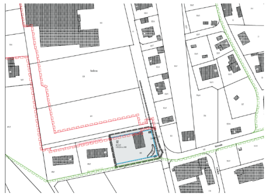
Baugebiet Leibertingen Ortsmitte Süd

Für das Gewerbegebiet Auf der Höhe Kreenheinstetten wurde die Aufstellung des Bebauungsplanes bedarfsgerecht beschlossen und befindet sich in Ausarbeitung.