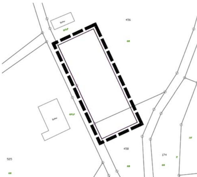
Bebauungsplan „Sondergebiet Schuppengebiet Im Aispen“: Räumlicher Geltungsbereich

Der Gemeinderat der Gemeinde Leibertingen hat am 20.10.2020 in öffentlicher Sitzung den Bebauungsplan „Sondergebiet Schuppengebiet Im Aispen“ in Leibertingen, Ortsteil Kreenheinstetten und die zusammen mit dem Bebauungsplan aufgestellten örtlichen Bauvorschriften als jeweils selbständige Satzung in der Fassung vom 02.10.2020 beschlossen.