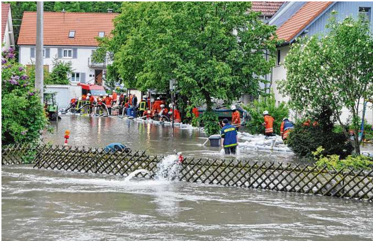
Das Jahrhunderthochwasser 2013 in Veringenstadt war die letzte große Katastrophe im Landkreis Sigmaringen. Nachrichten aus anderen Regionen machen aber deutlich, dass ähnliche Katastrophen immer wahrscheinlicher werden.

Bei einem solchen „Blackout“ fährt spätestens nach einigen Tagen auch der Rest dessen, was den modernen Alltag ausmacht, auf den Nullpunkt. Der Sigmaringer: „Es beginnt damit, dass die Supermärkte nicht mehr betriebsfähig sind.“ Die strombetriebenen Ladenkassen funktionieren nicht mehr. Wahrscheinlich würden noch nicht einmal die Eingangstüren aufgehen. Wer jetzt keine Vorräte zu Hause hat, könne eben nicht noch rasch etwas einkaufen, warnte der Beamte. Im Extremfall könnte es in dieser Situation sogar zu Plünderungen kommen. Natürlich kann in dieser Lage auch niemand mehr per Karte bezahlen. Der Gang zum Geldautomaten ist sinnlos, weil die elektronischen Bargeldauszahler ebenfalls mit Strom betrieben werden. Das Schreckensszenario setzt sich fort, wenn die Kanalisation und die Kläranlagen ausfallen. Die Trinkwasserversorgung werde ebenfalls zusammenbrechen. Der Blackout, so Gall, mache auch vor den Tankstellen nicht halt. Es gäbe im Landkreis zwar einige Notfalleinstellen. Dort werde Treibstoff aber nur an die Katastrophenhelfer der Polizei, Feuerwehr, des THW und der Rettungsorganisationen abgegeben. Privatleute hätten im Ernstfall keine Chancen, an Benzin oder Diesel zu kommen. Die Hilfsmöglichkeiten der öffent-