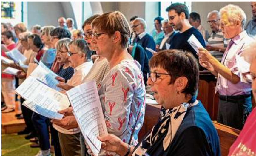
Die Kirchenchöre des Dekanats sangen auf der Orgelempore der Herz-Jesu-Kirche in Gorheim zum letzten Mal für ihren Dekan.