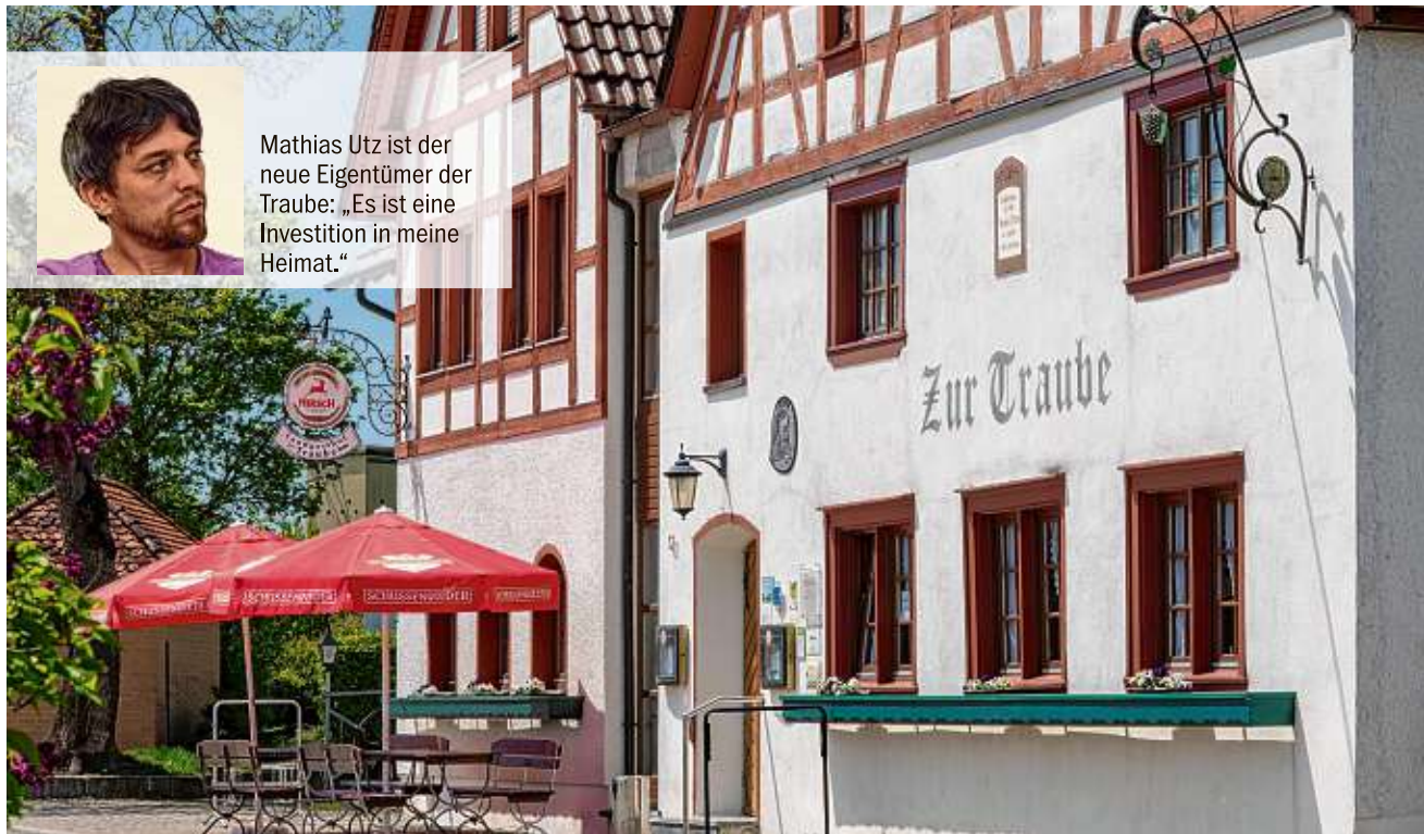
Das Geburtshaus von Wirtssohn Abraham a Sancta Clara: der Landgasthof Zur Traube.