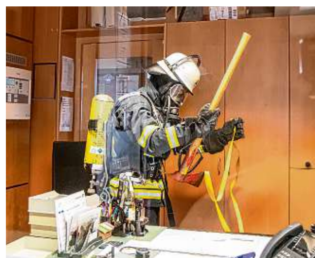
In den Verwaltungs- und Büroräumen der Jugendherberge mussten die Feuerwehrleute nach mehreren verletzten und bewusstlosen Personen suchen.