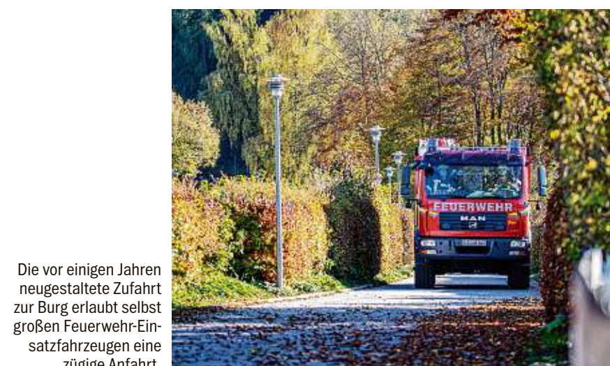
Die vor einigen Jahren neugestaltete Zufahrt zur Burg erlaubt selbst großen Feuerwehr-Einsatzfahrzeugen eine zügige Anfahrt.

der Übung galt dem Herrenhaus. Dort hatte ein defektes Küchengerät für einen Brand gesorgt, so die Übungsannahme. Durch den Qualm war es fünf Personen nicht mehr möglich, ins Freie zu gelangen. Hier zeigten sich die Tücken der spätmittelalterlichen Bauweise. Die Feuerwehrleute konnten wegen der engen und vor allem steilen Treppen die erwachsenen Simulanten nicht einfach auf eine Trage legen. Jetzt war der behutsame Transport über die steilen Stufen per Hand angesagt, was für die Einsatzkräfte in ihrer vollen Montur anstrengend war.