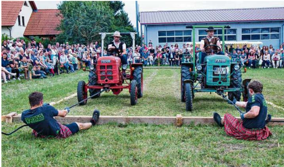
Ausschnitt aus dem Südkurier vom 02.09.19