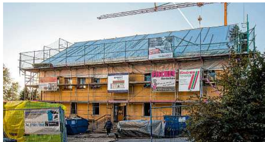
Noch präsentiert sich das ehemalige Thalheimer Rathaus als Rohbau. Wenn alles nach Plan geht, sollen in das Gebäude Ende 2020 die Vereine einziehen.