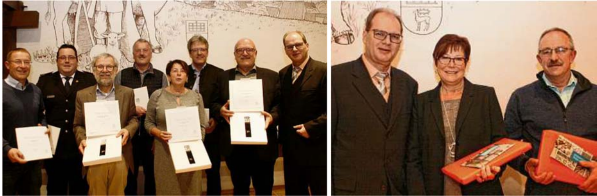
Ausschnitte aus dem Südkurier vom 08.01.19