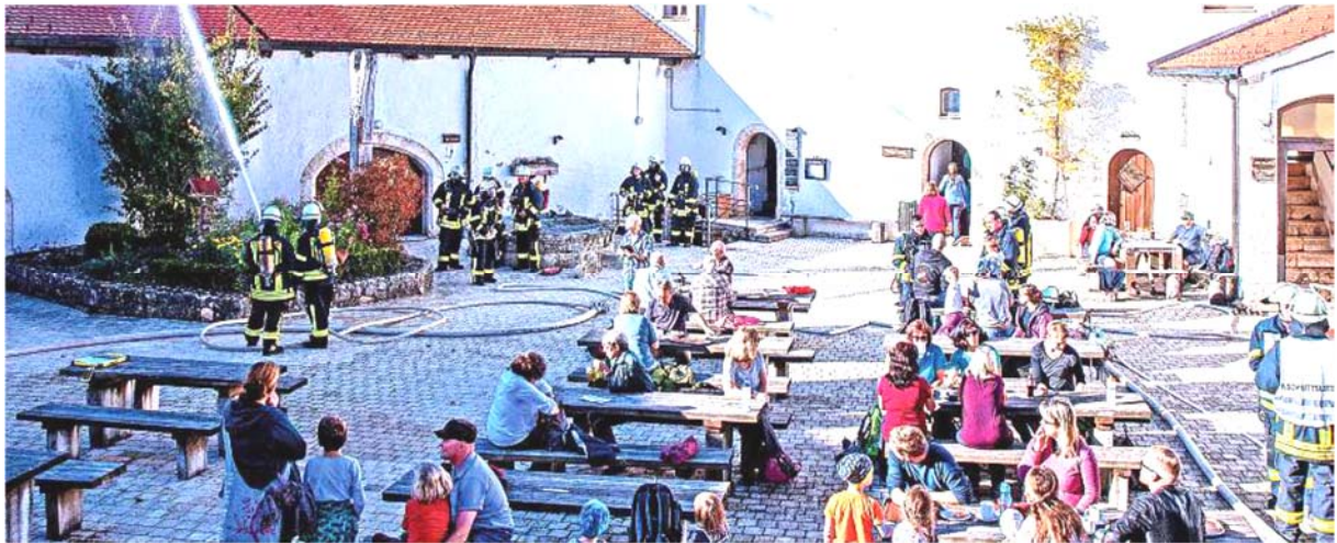
Ausschnitt aus dem Südkurier vom 28.10.19

Im Rahmen einer Kreenheinstetter Ortschaftsratsitzung stellte der neue Eigentümer des Gasthauses zur Traube in Kreenheinstetten, Mathias Utz , sein neues Nutzungskonzept vor. Er hatte das Gebäude von der Familie Gröner erworben und möchte dort nun Ferienwohnungen einrichten. Das erfordert den Einbau einer neuen Küche und Theke mit Kühl- und Lagerräumen. Die bestehende Heimatstube mit gusseisernem Kamin bleibt bestehen. Gegebenenfalls könnte für Gäste und Einheimische in der „alten Sausteige“ ein Automatenladen eingerichtet werden. Näheres hierzu finden Sie im anhängenden Presseartikel des Südkuriers vom 25.10.19.