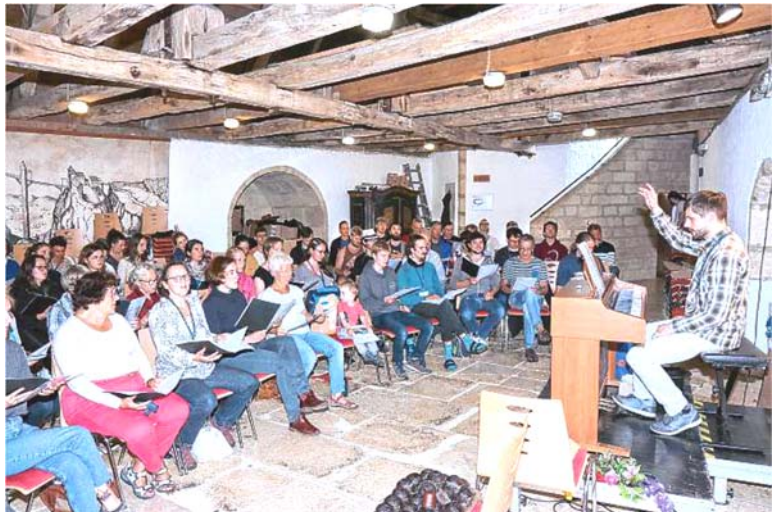
Ausschnitt aus dem Südkurier vom 22.08.19

Der Wildensteiner Singkreis traf sich wieder auf Burg Wildenstein . Er ist seit 1948 eine lebendige Gemeinschaft, die über Nachwuchsmangel nicht klagen muss. Die Familiengruppe besitzt beispielsweise derzeit 128 Teilnehmer. Sie ist die Abteilung des Singkreises, die sich in der Abschlusswoche in der Burg trifft. Zuvor waren schon die „Singvögel“ da. In dieser Gruppe finden sich Jungen und Mädchen zwischen zehn und zwölf Jahren ein. Für Zwölf- bis 15-Jährige schließt sich die Juniorengruppe I an. Ihr folgen in der Juniorengruppe II die Jugendlichen zwischen 15 und 17. Jede Gruppe hat das Ziel, ein Theaterstück, ein Gesangs- oder Instrumentalkonzert einzustudieren.