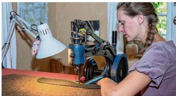
Ausschnitt aus dem Südkurier vom 05.09.19