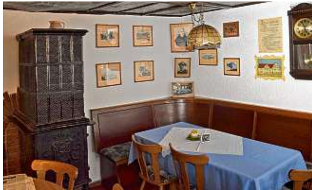
Die Gaststube der Traube steht wie keine zweite für ländliche Gasthauskultur im Geniewinkel.

Heimatsstube mit dem gusseisernen Ofen als Gastronomie zu erhalten und im Anbau einen Bereich mit (Ferien-)Wohnungen anzulegen. Das erfordert den Einbau einer neuen Küche und Theke mitsamt Kühl- und Lagerräumen hinter dem Gastraum. Die gesamte Gastronomie ist also zukünftig im Altbau untergebracht. Der zweite Stock dort bietet aktuell keine Bebauungsmöglichkeit. Die Stockhöhe ist mit 1,90 Meter zu niedrig und eine Anpassung des Dachausbaues ist zu kostspielig.