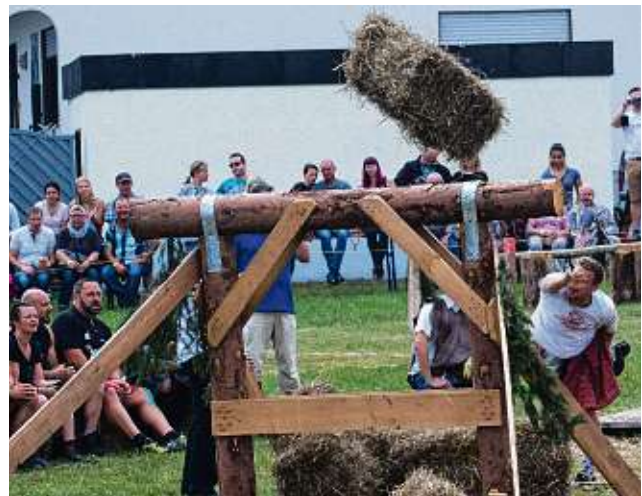
Zehn Strohballen mussten in möglichst kurzer Zeit über ein Hindernis geworfen werden, um beim „Strohbuschelwerfen“ zu punkten.

Beispielsweise beim „Stoiwuchta“. Diese Station ist ein Herzstück der Highlandgames. An einer Vorrichtung aus vier Baumstämmen gilt es einen 90-Kilo-Stein hoch zu ziehen. Bei sechs Wettbewerben greifen die Organisatoren auf Disziplinen zurück, die in der Vergangenheit schon mal den Einsatz der Gladiatoren gefordert hatten. In jedem Jahr geheimgehalten