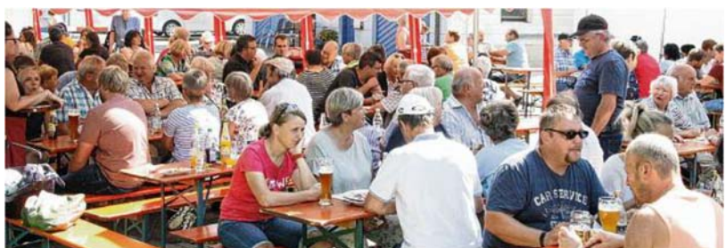
Ausschnitt von Südkurier am 27.08.19