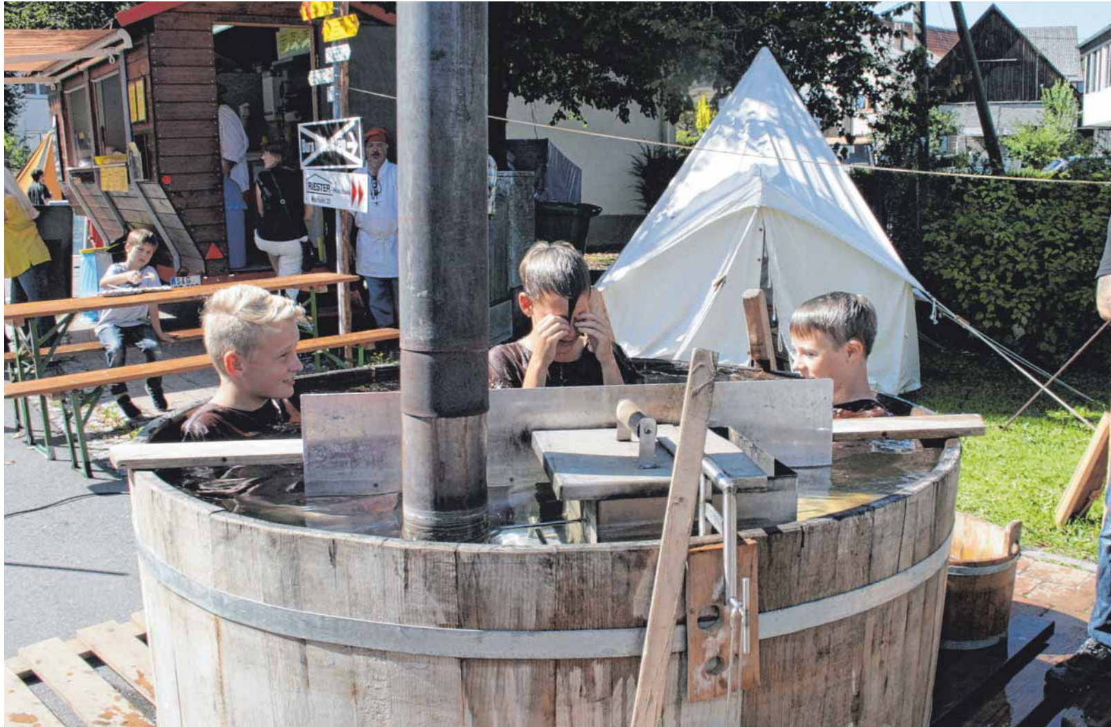
Bei einem Bad im Zuber kühlen sich die jungen Besucher des Wildensteiner Jahrmarkts ab.