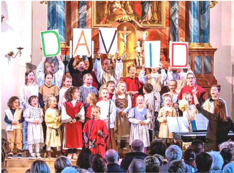
Ausschnitt aus dem Südkurier vom 22.10.19

Mit einem Festgottesdienst feierte am 20. Oktober die Gemeinde Thalheim ihr jährliches Wendelini-Fest unter Mitwirkung des Kirchenchors und des Gemeindeteams. Im Anschluss daran waren alle zum gemeinsamen Mittagstisch und zur Begegnung in die ehemalige Schule in Thalheim eingeladen.