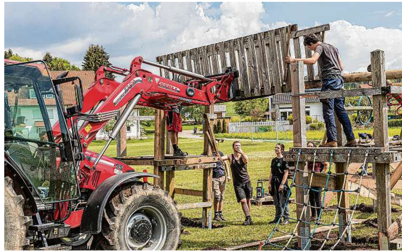
In Leibertingen zog am Wochenende ein kompletter Spielplatz um. Die KLJB sorgte für Abbau, Umzug und Wiederaufbau von sechs Spielgeräten und einem Sandkasten.