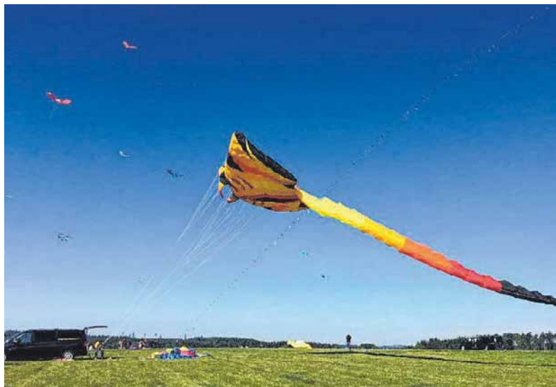
Beim Familiendrachenfest in Leibertingen sind die verschiedensten bunten Drachen zu entdecken.

Die „Danzleut“ führten mit der historischen Rathaustanzgruppe Tänze aus vergangenen Tagen auf. Für musikalische Unterhaltung sorgte außerdem die Musikkapelle Thalheim.