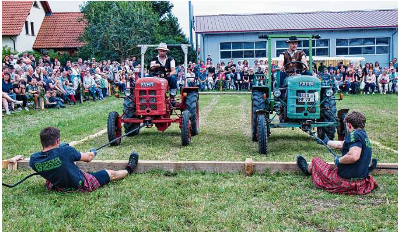
Ein Traktor mit einem Gewicht von einer Tonne war beim Traktorziehen 18 Meter weit zu ziehen. Ein Kraftakt für die Teilnehmer und ein spannendes Schauspiel für die Zuschauer bei den 20. Schwäbischen Highlandgames in Kreenheinstetten.