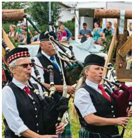
Sie dürfen mit Dudelsäcken nicht fehlen: die Heuberg-Drachens-Pipeband.

Beispielsweise beim „Stoiwuchta“. Diese Station ist ein Herzstück der Highlandgames. An einer Vorrichtung aus vier Baumstämmen gilt es einen 90-Kilo-Stein hoch zu ziehen. Bei sechs Wettbewerben greifen die Organisatoren auf Disziplinen zurück, die in der Vergangenheit schon mal den Einsatz der Gladiatoren gefordert hatten. In jedem Jahr geheimgehalten