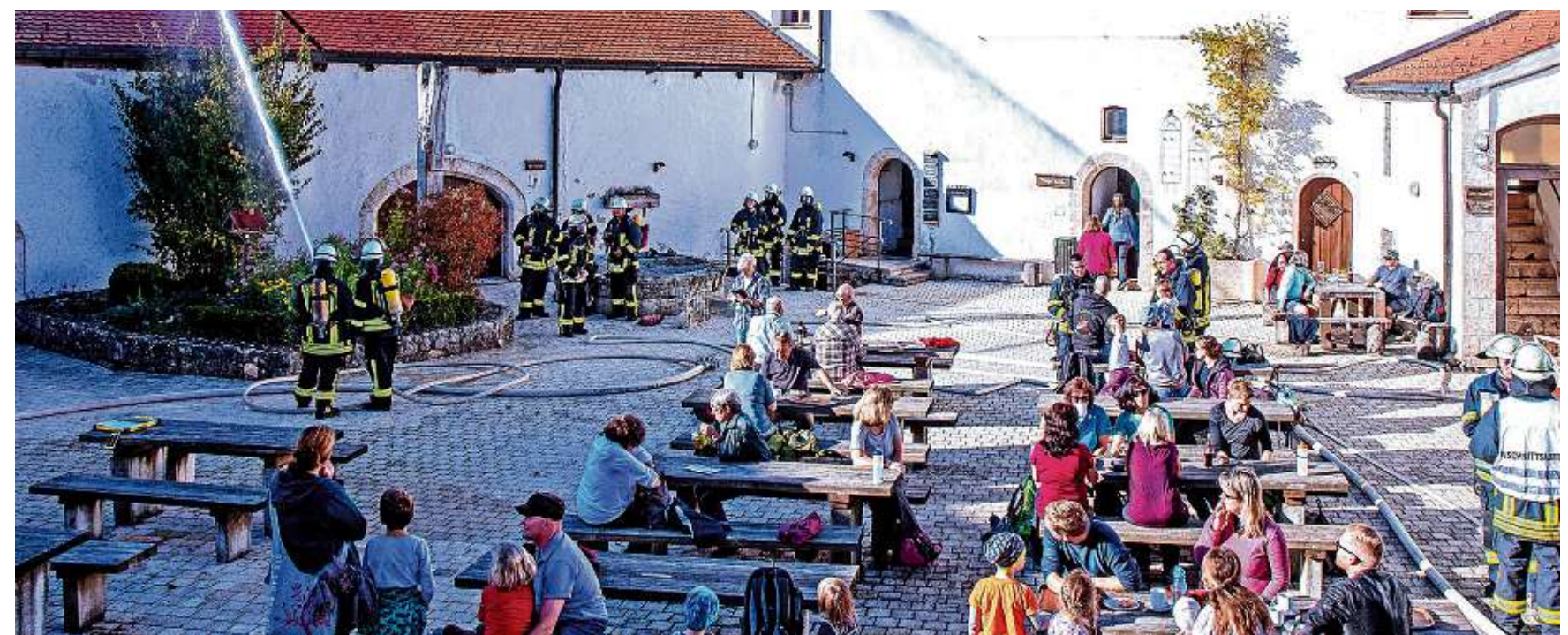
Die Gäste im Innenhof der Burg Wildenstein konnten bei Kaffee und Kuchen die Jahresabschlussübung der Leibertinger Gesamtfeuerwehr hautnah mit verfolgen. Im Ernstfall hätten sie den Innenhof allerdings verlassen müssen.