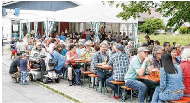
Ausschnitt aus dem Südkurier vom 14.06.19

Die Alzheimer Landjugend glänzte als Gastgeber beim Gartenfest . Das KLJB-Küchenteam und das Bedienungspersonal kümmerten sich für das leibliche Wohl der vielen Gäste. Mit flotter Blasmusik sorgte die Musikkapelle Thalheim für tolle Stimmung. Am Abend spielte der Musikverein Krumbach zur Unterhaltung auf.