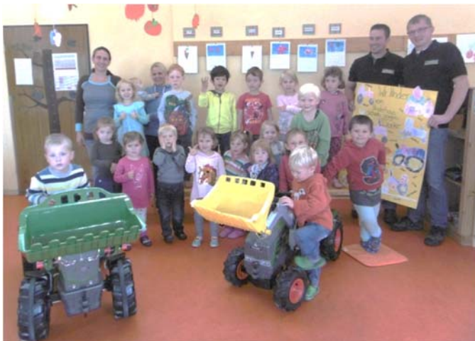
Die Kinder konnten es kaum erwarten, die Traktoren endlich benutzen zu dürfen.

An dieser Stelle bedanken sich der Elternbeirat, das Team sowie alle Kinder des Kinderhauses recht herzlich für diese großzügige Spende.