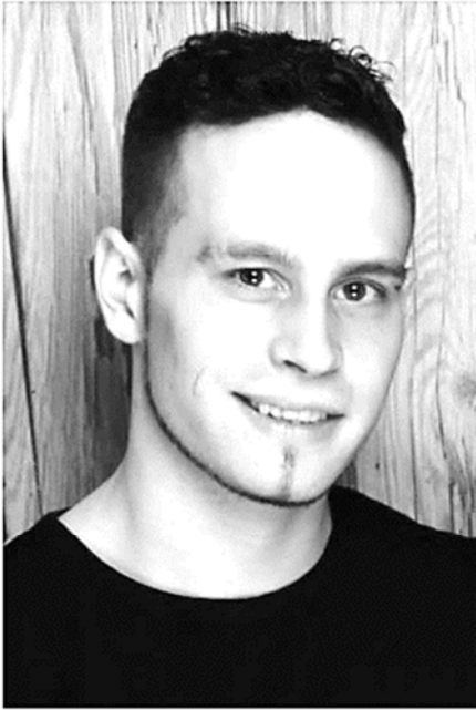
Leibertingen im Juni 2019 statt Karten