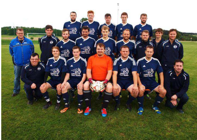
Bild der 2. Mannschaft des SC B.A.T. 2015