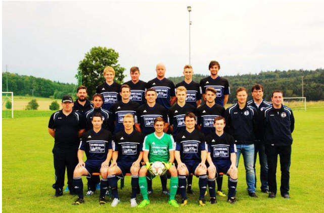
Bild der 1. Mannschaft des SC B.A.T. 2015

werden, da der Kader einfach zu dünn ist. Hoffen wir auf einen versöhnlichen Abschluss des Jahres 2015 mit einem Sieg gegen die TSV Ach- Linz II.