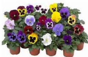
Stiefmütterchen verschiedene Farben

Friedhofsblumen zu Allerheiligen aus der Gärtnerei Kuppel.