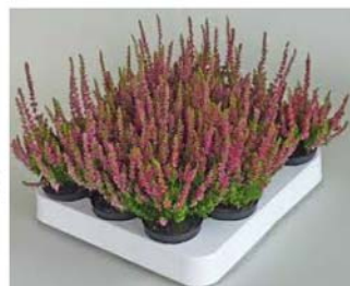
Besenheide verschiedene Sorten