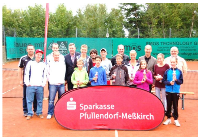
Bild alle Kreismeister v.l.n.r.