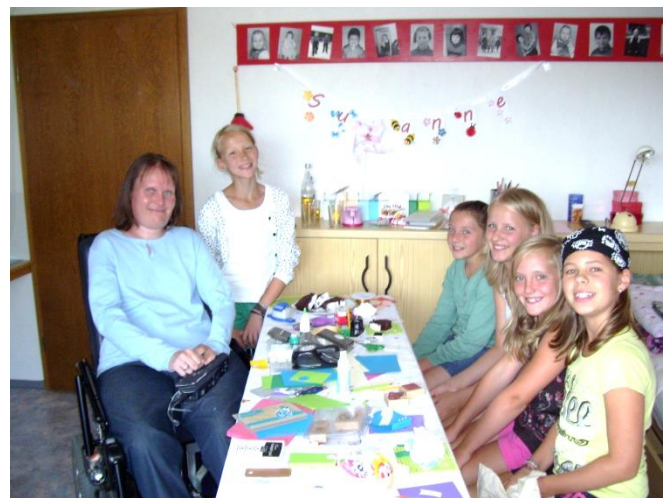
(Freudige Gesichter beim Papierbasteln in Kreenheinstetten)